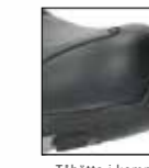
Tåhätt i komposit