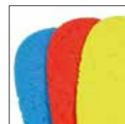
HAIX® Vario Wide Fit