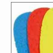
HAIX® Vario Wide Fit