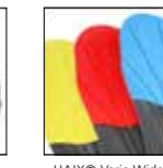
HAIX® Vario Wide Fit