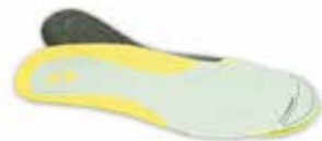
Denna sula används för dig som har en bred läst Beställningsnummer: 901456W