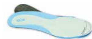
Denna sula används för dig som har en smal läst Beställningsnummer: 901457N

Konstruktionen bygger på omfattande statistik ett brett spektra av individer och individuella behov. Sulornas kärna är tillverkad i PU-skum och har en hög grad av komfort, dämpning, ventilation och fukttransportförmåga. Sulorna har ett överdrag av 100% polyester. Perfect fit sulorna har en gradering som tydligt visualiseras av en färgskala, se nedan.