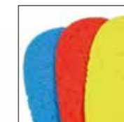
HAIX® Vario Wide Fit