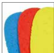
HAIX® Vario Wide Fit

CE EN ISO 20347:2012 O2 HRO HI CI FO SRC Microfiber/textil med ventilerad innerliner. Skafthöjd 18.5 cm, antistatisk, sula 018 Högt skaft | Färg: Svart | Art.nr: 330004