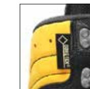
HAIX® Climate system