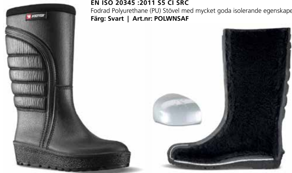
EN ISO 20345 :2011 S5 CI SRC Fodrad Polyurethane (PU) Stövel med mycket goda isolerande egenskaper Färg: Svart | Art.nr: POLWNSAF