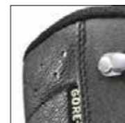
HAIX® Climate system